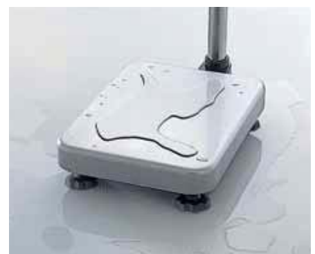
IP65 Plattform mit Edelstahl-Wiegeplatte

Zusätzlich zur Eigensicherheit ist die Plattform der HV-CEP / HW-CEP-Serie geschützt gemäß IP65 gegen Staub und Flüssigkeiten und kann so problemlos gereinigt werden. Außerdem ist die Oberfläche der Wiegeplatte aus Edelstahl und somit gegen Chemikalien, Kratzer und Korrosion beständig.