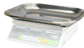
MEP/AVI mit Schale