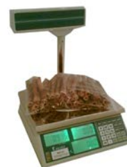
MEP-15/30kg mit Hochanzeige